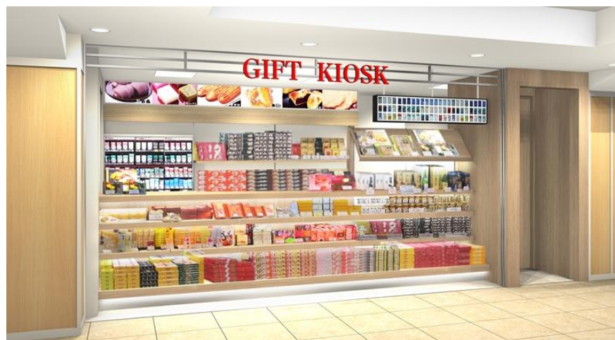
店舗イメージ(待合室側)