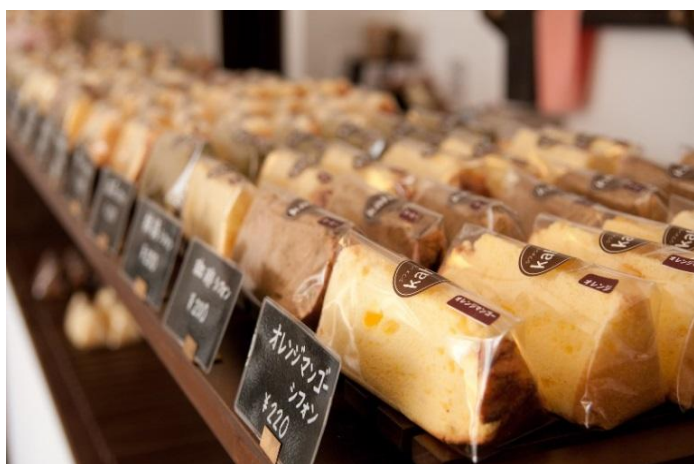
シフォンケーキ(イメージ)

※「ベルマートキヨスク新横浜在来」店のほか、「グランドキヨスク新横浜」店（JR新横浜駅新幹線のりば東口前）でもお取扱いいたします。