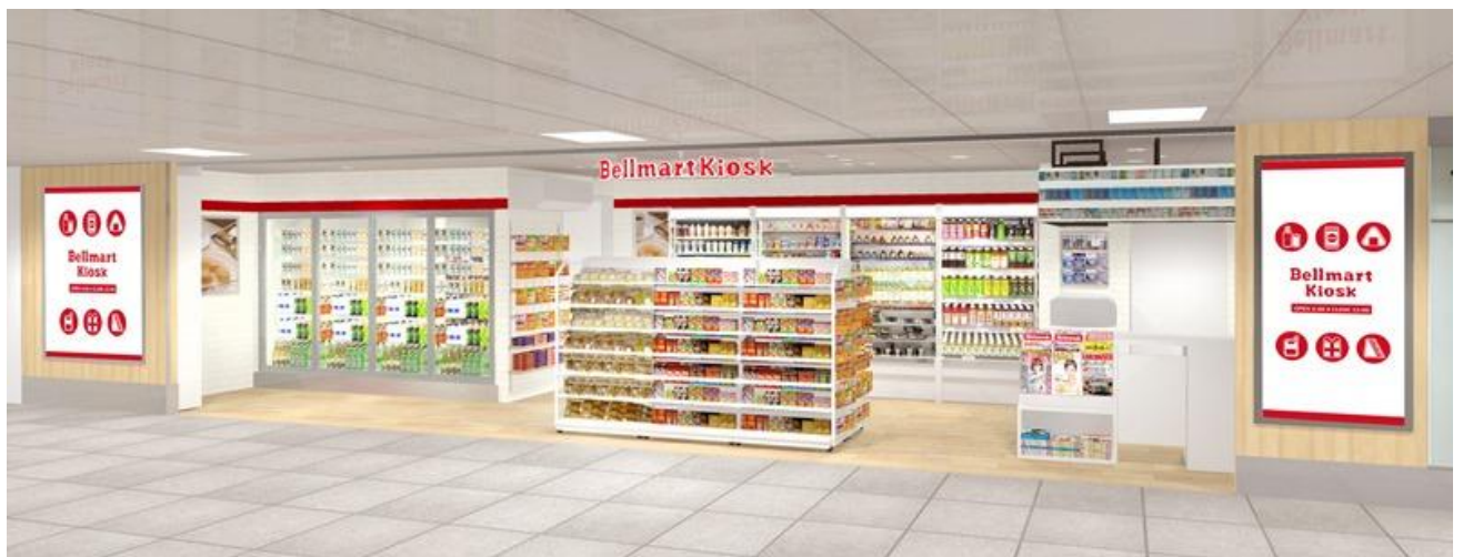
店舗イメージ(横浜線(在来線)北口改札側)