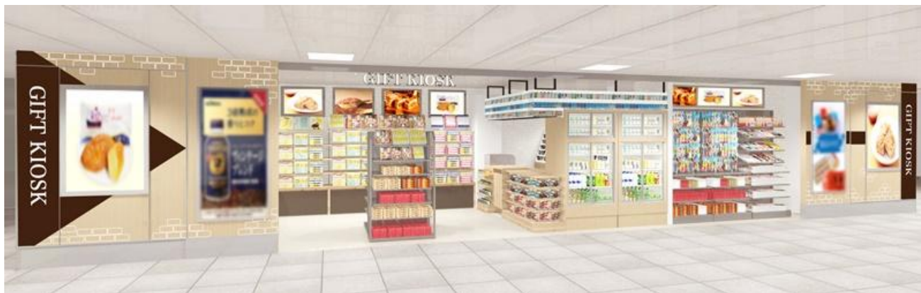
店舗イメージ(東海道新幹線東乗換口改札内)