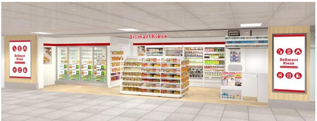
店舗イメージ(横浜線(在来線)北口改札側)