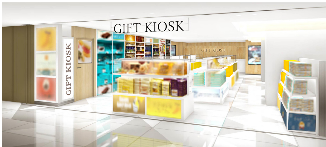
「ギフトキヨスク東京ギフトパレット」店舗イメージ

ギフトキヨスク東京ギフトパレットは、定番のお土産からご訪問用・ご自宅用の手土産、東京で人気の新商品など、より幅広いラインアップを取り揃え、東京駅をご利用される様々なお客様のニーズにお応えしていきます。