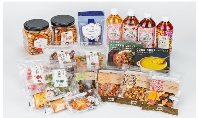
クイーンズ伊勢丹商品イメージ

クイーンズ伊勢丹ブランド商品の中から、グローサリー・パン・総菜など、東京駅では初となる高品質な選りすぐりの商品を販売してまいります。