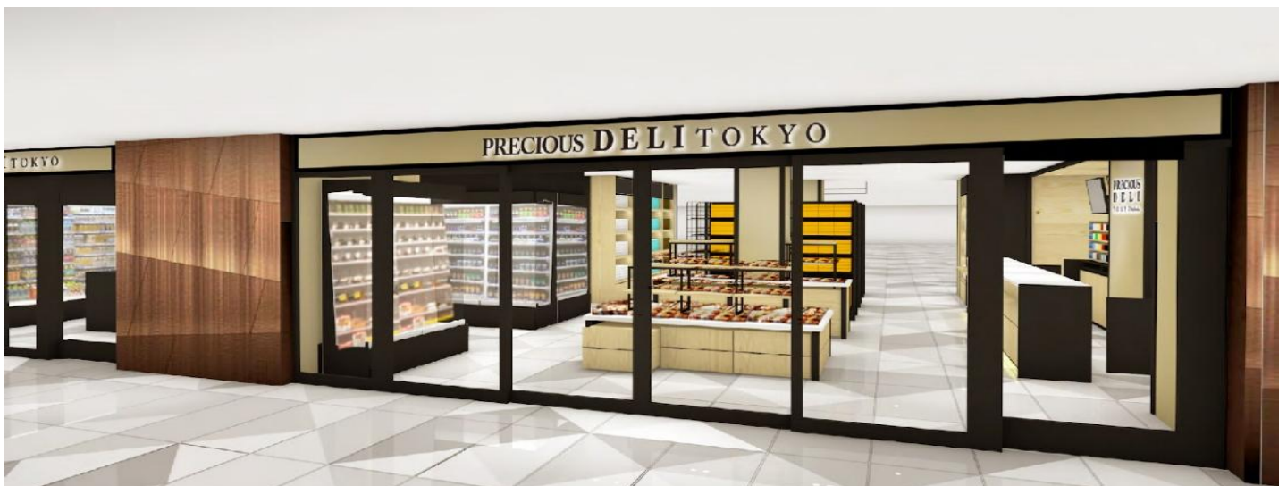
「プレシャスデリ東京」店舗イメージ