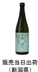
販売当日出荷 (新潟県)

販売当日にしぼった“生原酒”を、東海道新幹線を利用して東京駅から名古屋駅へ直送。