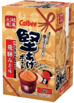
堅あげポテト 飛騨みそ味

駿河湾産桜えびの香ばしい 味わいが、カリカリッと 噛むほどうまい！ 堅あげポテトで味わえます。