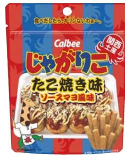
じゃがりこ たこ焼き味 ソースマヨ風味スタンドパック