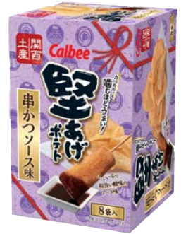
堅あげポテト 串カツソース味

関西名物「たこ焼き」の味を じゃがりこで再現しました。 ソースとマヨネーズのkokoroが くせになる味わいです。