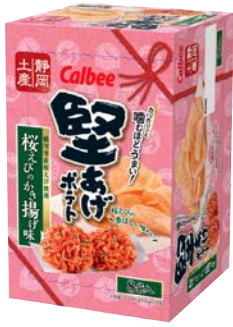
堅あげポテト 桜えびのかき揚げ味